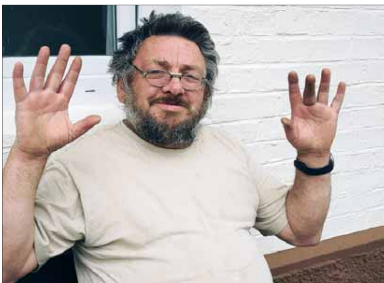
„Der Gesunde arbeitet für den nicht ganz Gesunden mit, so dass beide leben können“.

sen Unternehmen arbeiten wir sehr sorgfältig zusammen. Unsere Qualität ist gefragt, ebenso unsere Termintreue. Das zeichnet uns aus. Wir können nicht davon ausgehen, dass wir irgendwelche Bastelarbeiten machen, sondern wir müssen produzieren als verlängerte Werkbank, sowie es auch in der Festschrift beschrieben ist. Wir sind im Moment gut gefragt, und das bestätigt uns auf diesem Kurs.