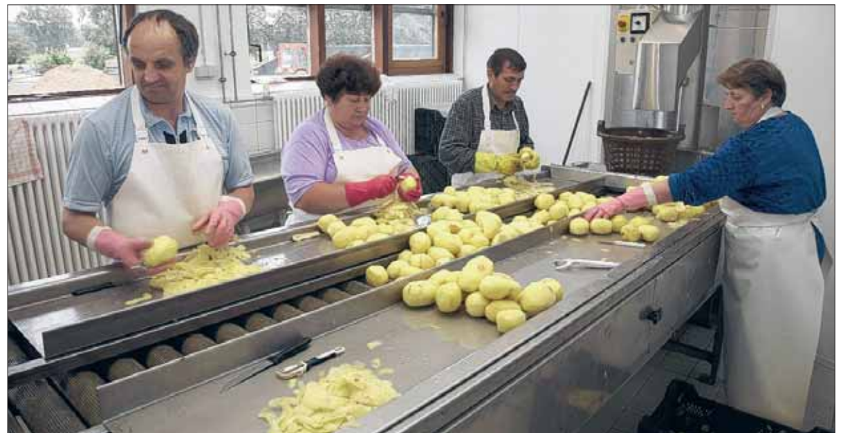
„Beispielhaft ist unser Schälbetrieb. Er hat schon viele Kunden gefunden. Jetzt bekommen wir auch das nötige Qualitätssiegel“.