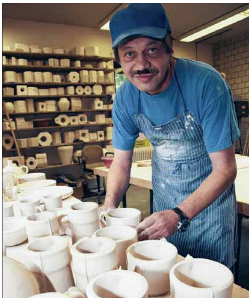
„Unsere Qualität ist gefragt, ebenso unsere Termintreue“.